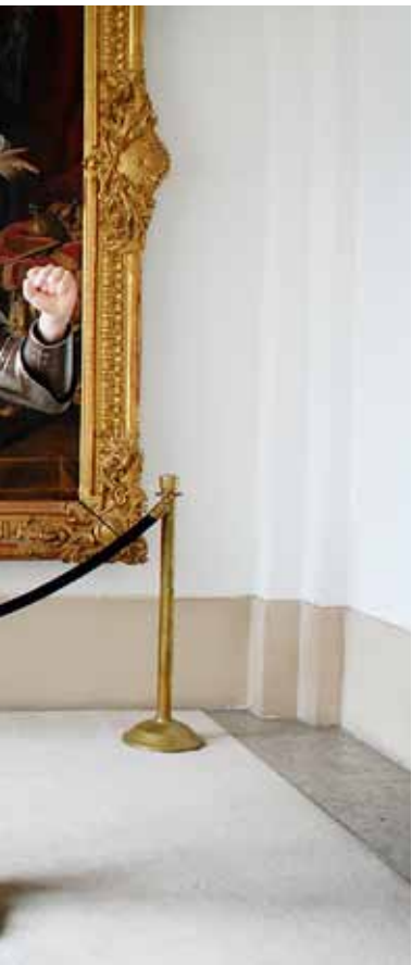
dansk kung och i min monolog klara sig. Man kan ju föreställa sig jag inte gjort förr. Den var väldigt